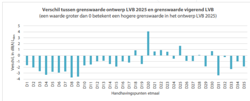
Figuur 5 Verschil in grenswaarden voor de etmaalperiode tussen vigerend LVB en ontwerp LVB 2025, op basis van Doc29 en bepaald in de vigerende LVB-handhavingspunten.

secundaire Buitenveldertbaan) bij de primaire banen vinden - soms zelfs zeer forse - verlagingen plaats.